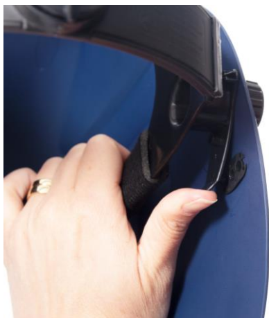
5.2 Einstellung des Winkels zwischen Schutzvisier und Kopfgeschirr. Winkel zum Schutzvisier.