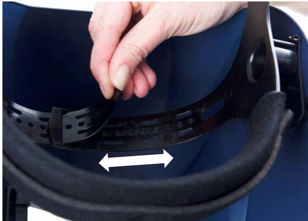
5.1 Höheneinstellung. Höhe des Schweißschutzvisiers am Kopf.