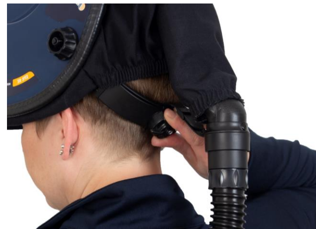
5.4 Weiteneinstellung des Kopfgeschirrs. Einstellung der Weite des Kopfgeschirrs.