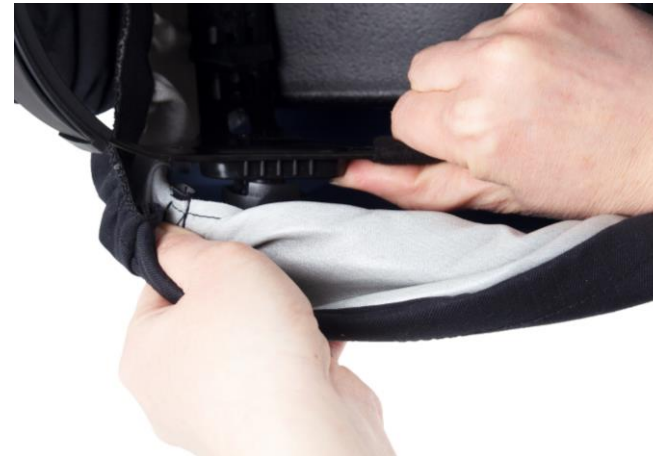
5.3 Einstellung des Abstands zwischen Schutzvisier und Kopfgeschirr. Abstand zum Schutzvisier.