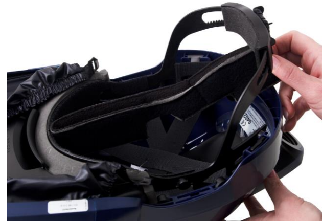
7.3 Montera kardborrbandet med den ruggade sidan mot pannbandet och urtaget uppåt.