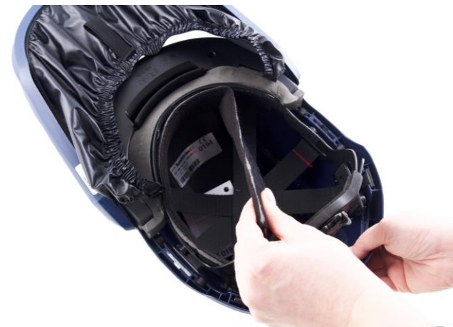
7.2 Dra loss svettbandet.