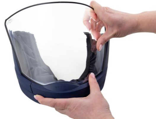
5.3 Avlägsna siktskivan.