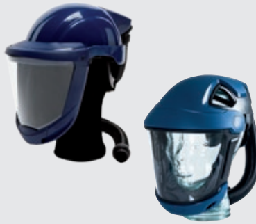
SR 580 Helm mit Visier oder SR 570 Gesichtsschutz mit oder ohne Anstoßkappe, je nach Arbeitssituation.