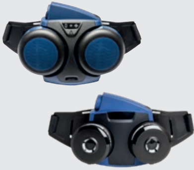
Gebläse SR 700 oder SR 500 mit Partikelfilter SR 510 P3 R.

Höhere Arbeitsbelastung, höhere Staubkonzentrationen und für Nutzer, die glatt rasiert sind und Gesichtsbehaarung haben (Bart oder Koteletten).